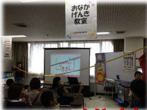
おなかげんき教室