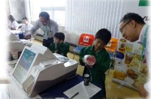
コンビニレジ打ち体験