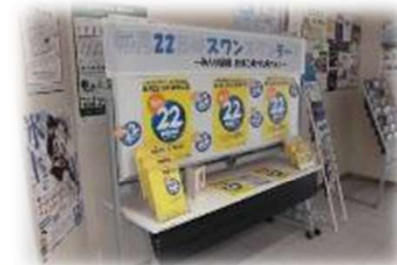
【沼ノ端交流センター】