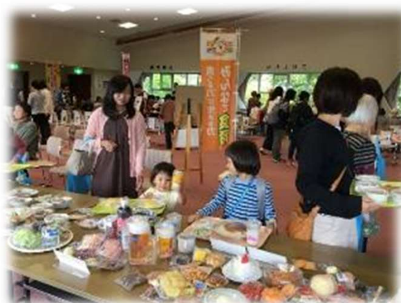
食事バランスチェック